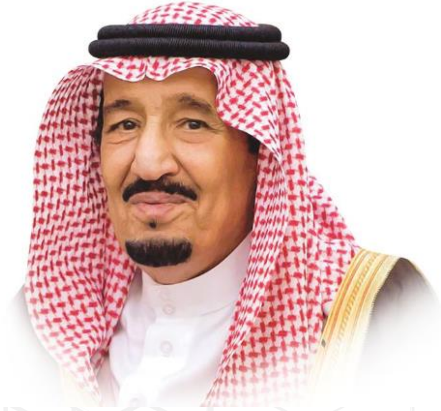
خادم الحرمين الشريفين الملك سلمان بن عبد العزيز آل سعود (حفظه الله)