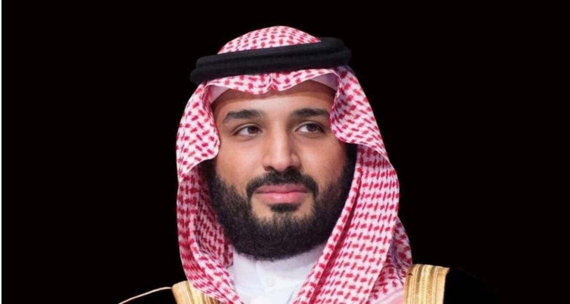
صاحب السمو الملكي الأمير محمد بن سلمان بن عبد العزيز آل سعود ولي العهد نائب رئيس مجلس الوزراء