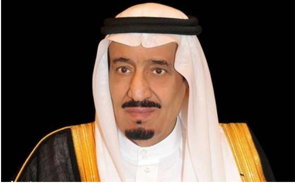
خادم الحرمين الشريفين الملك سلمان بن عبد العزيز آل سعود حفظه الله