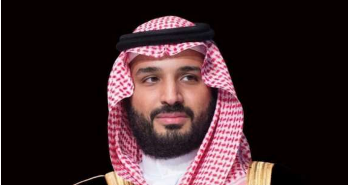
صاحب السمو الملكي الأمير محمد بن سلمان بن عبدالعزيز آل سعود ولي العهد نائب رئيس مجلس الوزراء